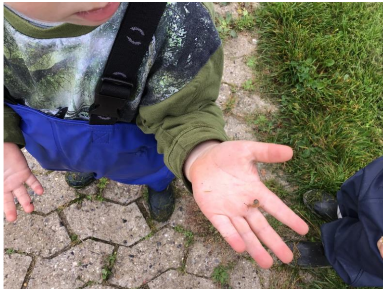
På tur med vuggestuen – hvad mon vi finder?